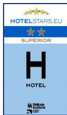
2 sterren SUPERIOR