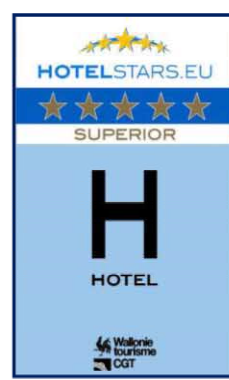
5 sterren SUPERIOR ».