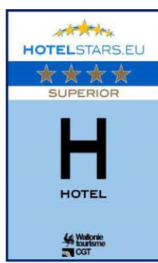
4 sterren SUPERIOR