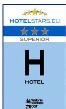
3 sterren SUPERIOR