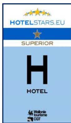
1 ster SUPERIOR