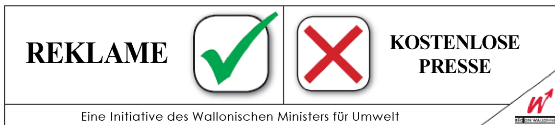
Klebeetikett - Muster Nr. 3.

Die Personen, die das Klebeetikett nach dem Muster Nr. 3 anbringen, äußern ihren Willen, keine kostenlose Informationspresse aber wohl die Reklameblätter zu erhalten.