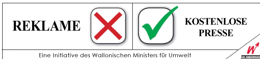
Klebeetikett - Muster Nr. 2.

Die Personen, die das Klebeetikett nach dem Muster Nr. 2 anbringen, äußern ihren Willen, keine Reklameblätter aber wohl die kostenlose Informationspresse zu erhalten.