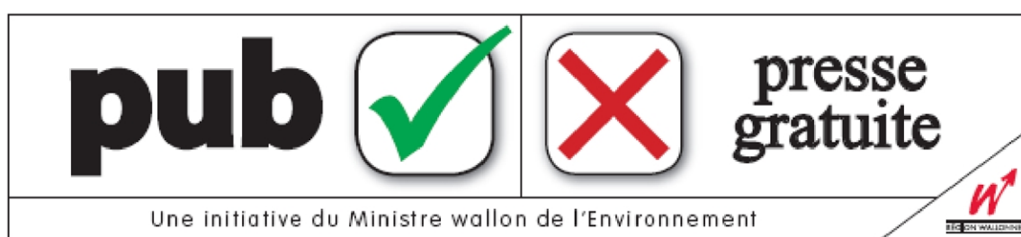
Modèle d'autocollant n° 3.

Les personnes qui apposent l'autocollant répondant au modèle n° 3 manifestent leur volonté de ne pas recevoir la presse d'information gratuite mais bien des imprimés publicitaires.