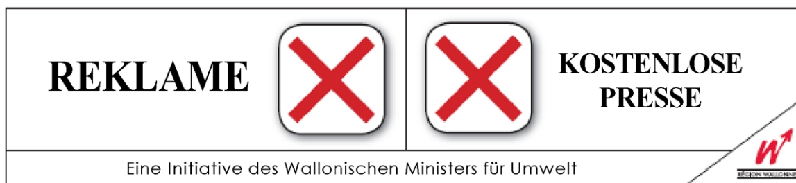
Klebeetikett - Muster Nr. 1.

Die Personen, die das Klebeetikett nach dem Muster Nr. 1 anbringen, äußern ihren Willen, weder Reklameblätter noch kostenlose Informationspresse zu erhalten.